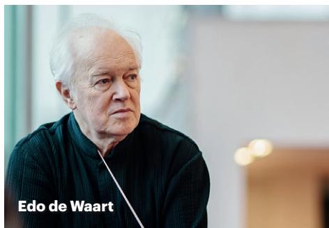
Edo de Waart