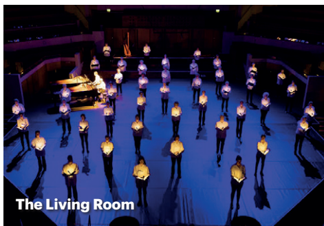
The Living Room

VRIJDAG 21 APRIL 2023 TivoliVredenburg, Utrecht