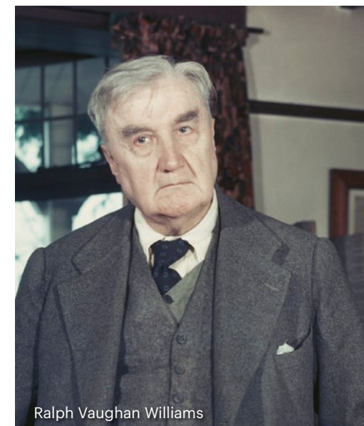
Ralph Vaughan Williams

Aan het begin van de twintigste eeuw was het verzamelen van de liederen die onder het volk buiten de stad leefden een ware hype. Door de nog relatief jonge opnametechnieken zoals de fonograaf konden de klanken van deze volksmelodieën voor de eeuwigheid bewaard blijven. Zo was ook Ralph Vaughan Williams geïnteresseerd in de volksmuziek van zijn vaderland die hij op het Engelse platteland verzamelde. De melodieën blies hij nieuw leven in door ze te gebruiken voor zijn composities. Zo kon de geest van de Engelse countryside voortleven in de concertzalen van de grote steden. In 1907 nam Vaughan Williams een zingende herbergier in het Engelse dorpje Rusper