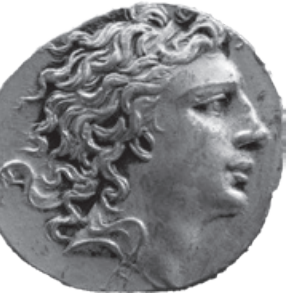
Mithridates VI Eupator, koning van Pontus; munt

terwijl de meer geoefende luisteraar ook de foutloze detailwerking zal waarderen – geen coloratuur teveel, ingenieus psychologisch laagjeswerk, meesterlijke muziekdramaturgie. Ook de strakke en consistente tone of voice van het dramatische narratief, het buitenissig knappe contrapunt en de vindingrijke instrumentatie zijn adelbrieven waarop deze 'tragedia per musica' trots teren mag.