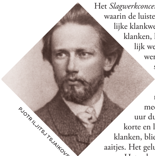
PJOTR ILJITSJ TSJAIKOVSKI

Het Slagwerkconcert nr.2 bestaat uit één doorlopend geheel, waarin de luisteraar wordt meegenomen in de wonderbaarlijke klankwereld van de slagwerker. Daarin zijn meer klanken, kleuren en sferen te horen dan voor mogelijk werd gehouden. De orkestbezetting voor dit werk bevat al een heel uitgebreide percussie-sectie en daar komen dan nog eens de verschillende trommen, raspen, houtblokken, triangel, cymbalen, stukken metaal, marimba's, vibrafoons (en nog veel meer) van de slagwerksolist bij. Een klein half uur duurt de onderdompeling in een zee van korte en lange melodieuze of ritmische motieven, klanken, bliepjes, messcherpe klappen en zijdezachte aaitjes. Het geluid golft, begint snoeihard, vervaagt en veert weer op. Het orkest veert mee en voert de muziek van hemelse hoogten tot diepdonkere krochten, waarbij soms eerdere thema's weer opduiken en andere verdwijnen. Hoe dicht de instrumentatie soms ook is, iedere noot en elke klank doet ertoe en is kraakhelder te horen. Balans in dit alles is er ook: naast complexe energieke episodes zorgen doorzichtige kamermuziekpassages voor adempauzes.