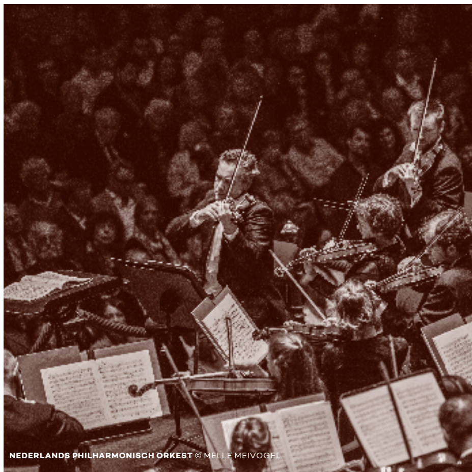
NEDERLANDS PHILHARMONISCH ORKEST